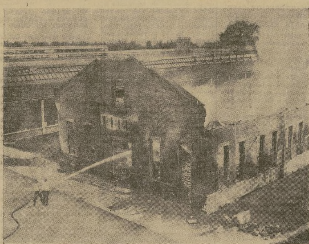
Ruinas humeantes de la imprenta de la prisión de Pontiac, Illinois, incendiada durante un motín de mil presos que intentaban escapar en masa, en que resultó un reo muerto y 23 heridos.