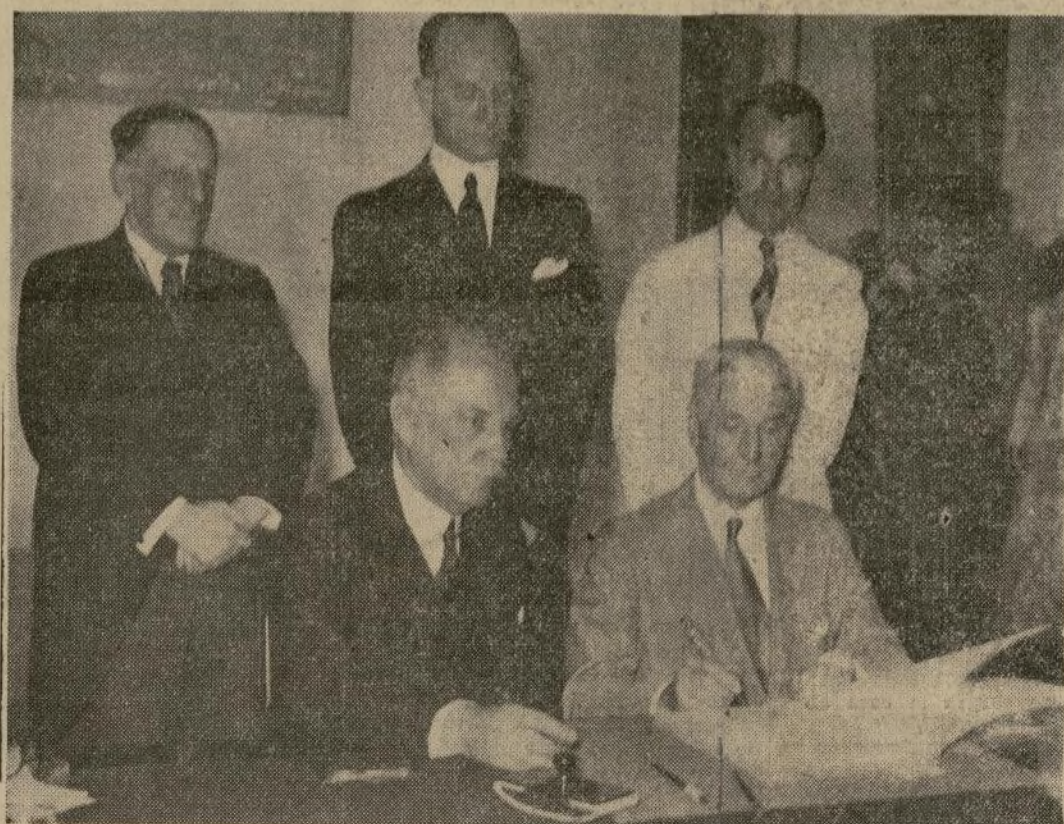
Firma del tratado de reciprocidad con la isla. Señados, de izquierda a derecha: el secretario de Estado de Cuba, don Cosme de la Torre; el secretario de Estado, Cordell Hull; de pie: el embajador de Cuba en los Estados Unidos, don Manuel Márquez Sterling; el subsecretario de Estado, Sumner Welles; y el embajador de los Estados Unidos en Cuba, Jefferson Caffery.