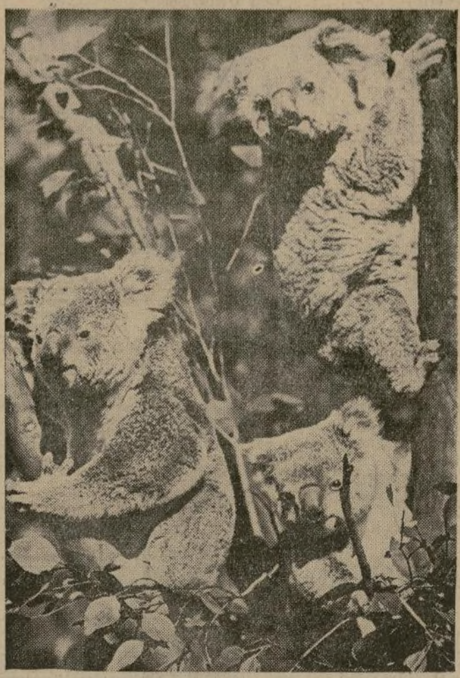
Osos australianos, que se alimentan solo de las hojas tiernas del eucalipto y que no pueden digerir ningún otro alimento, trepando a un árbol en una selva cercana a Sydney.