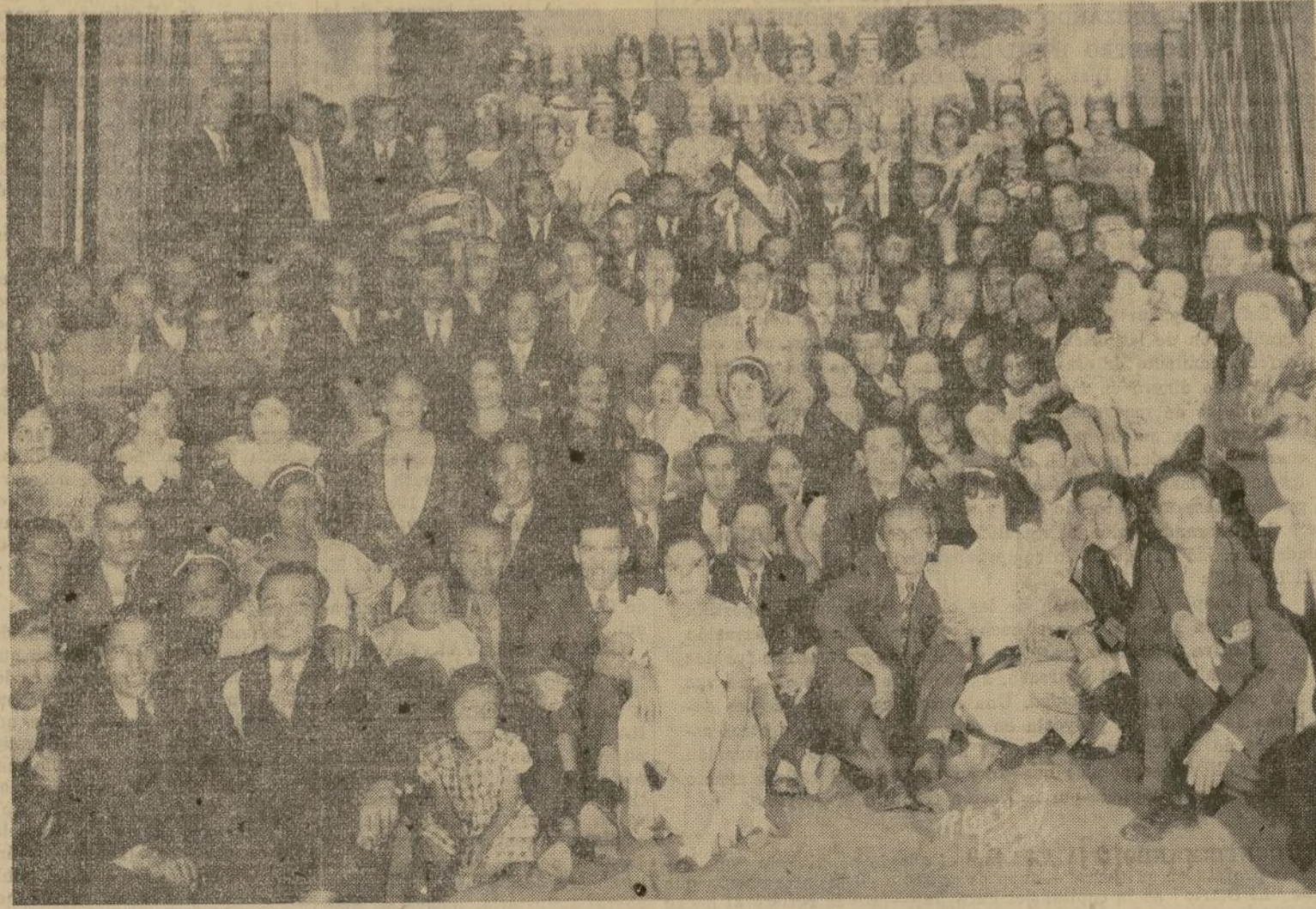
Bajo los auspicios del Hispano América Athletic Club, se efectuó el sábado por la noche un alegre y concurrido festival, al cual asistió una numerosa representación de nuestras colonias, particularmente de la peruana y ecuatoriana. Bailes incaicos y cantos quechuas, fueron la nota típica de la velada, que dejó muy complacidos a organizadores e invitados.

EL FESTIVAL INCAICO CELEBRÓSE CON BRILLANTEZ