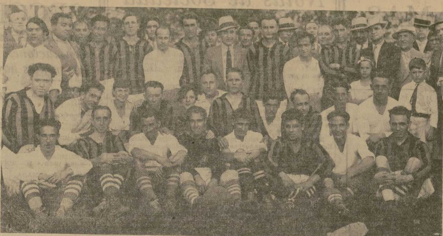
El cuadro de "actuales" del Galicia F. C., venció el domingo Galicia S. C., después de hermosa exhibición. Los veteranos pero sin éxito. En la fotografía puede verse a unos y otros, entusiasmo, apoyaron económica y moralmente a los "antiguos". Dos genuinas generaciones del

La victoria del mejicano se proclamó como un verdadero triunfo, toda vez que el americano había logrado vencer al celebrado Gaona, el azteca formidable, por vía decisiva.