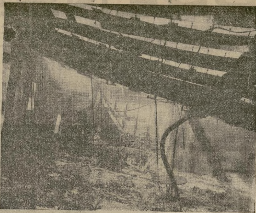
Destrozos de un camarote de lujo en la cubierta B después que las llamas barrieran la elegante sección. En el fondo se ven las armazones de las camas.