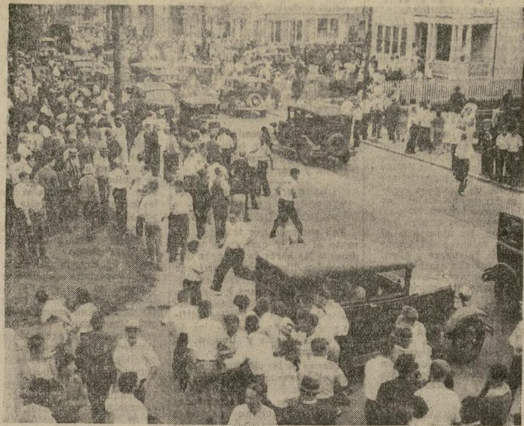
La muchedumbre huye de los soldados durante el tumulto en una fábrica de tejidos en Saylesville, en que ocho simpatizantes de los huelguistas recibieron balazos, y 132, incluyendo 18 soldados, resultaron con heridas de otra clase. El gobernador Green ha movilizó toda la Guardia Nacional, y ha puesto a Saylesville bajo ley marcial.