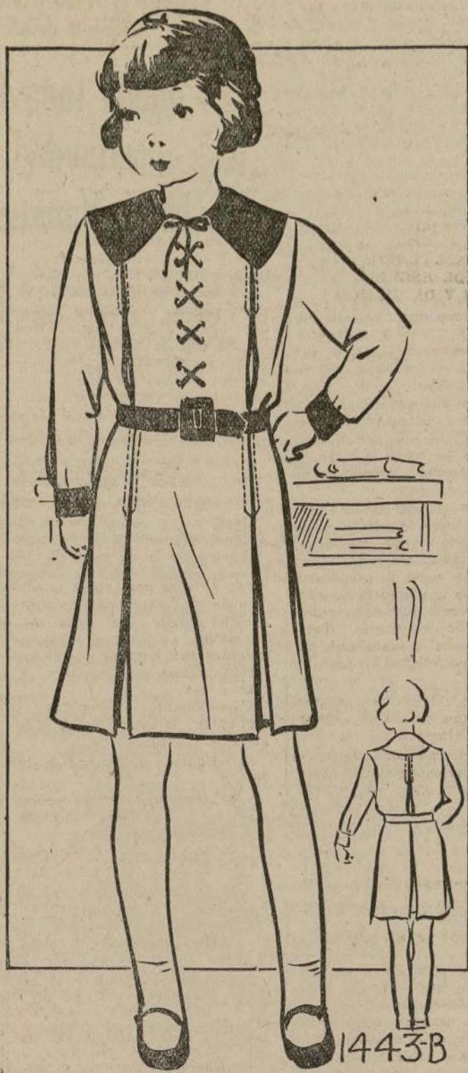
VESTIDO DE ESCUELA PARA NIÑAS DE SEIS A DOCE AÑOS

1443-B.—Este vestido es un ejemplo excelente de lo que están proyectando las madres elegantes para suplir el guardapolvo de sus niñas. Es de corte sencillo, con dos pliegues invertidos en el frente y uno en el centro posterior; estos le dan amplitud suficiente para que la niña pueda participar en todos los juegos propios de las niñas de esta edad. Para la confección de este modelo está muy apropiada la lana algo gruesa, por ser muy práctica y de duración. Se puede conseguir en tejidos distintos, cuadros, rayas o escoceses. Cualquiera de estos estaría de acuerdo con la moda de Otoño. El cuello y los puños son de color más oscuro formando contraste con el vestido. Las cintas del frente están pasadas por ojales y si estas no se quieran poner se pueden substituir por lazos o corbata. Se puede usar otras telas además de la lana; el "velveteen" adornado con puños y cuello de crepé o encaje también está bien. Los materiales de algodón se usarán mucho para la escuela en piqué y poplin. Los colores más favoritos para vestidos de niñas son el azul marino, el color vino y el verde botella. Este diseño se puede conseguir en los tamaños siguientes: 6, 8, 10 y 12. Para el tamaño 8 se necesita 1 y cinco octavos yardas de tela de 54 pulgadas de ancho. 5 octavos de yarda para el cuello y los puños. El costo de este patrón es de 20c. Solo en los tamaños especificados. Al ordenar cualquiera de estos patrones, envíame el cheque de la medida exacta que te necesito.