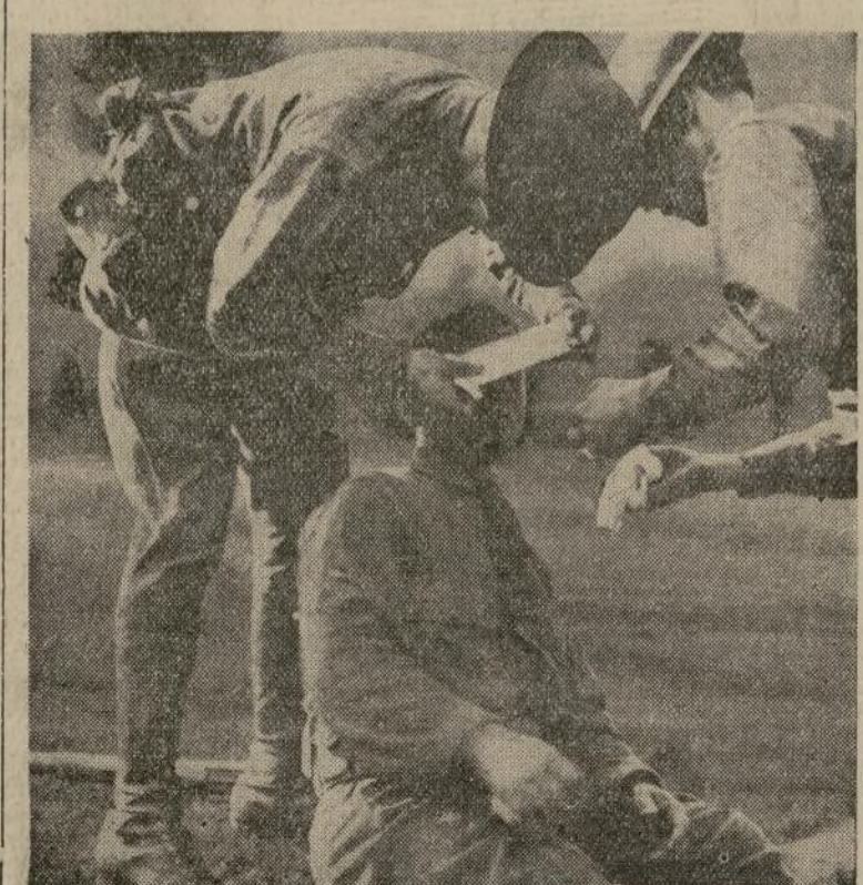
Una certera pedrada dió en tierra con este soldado durante el tumulto en la fábrica de tejidos de Rhode Island en que una muchedumbre de 5,000 huelguistas mantuvo a las tropas a la defensiva detrás de un cerco de alambre de púas.