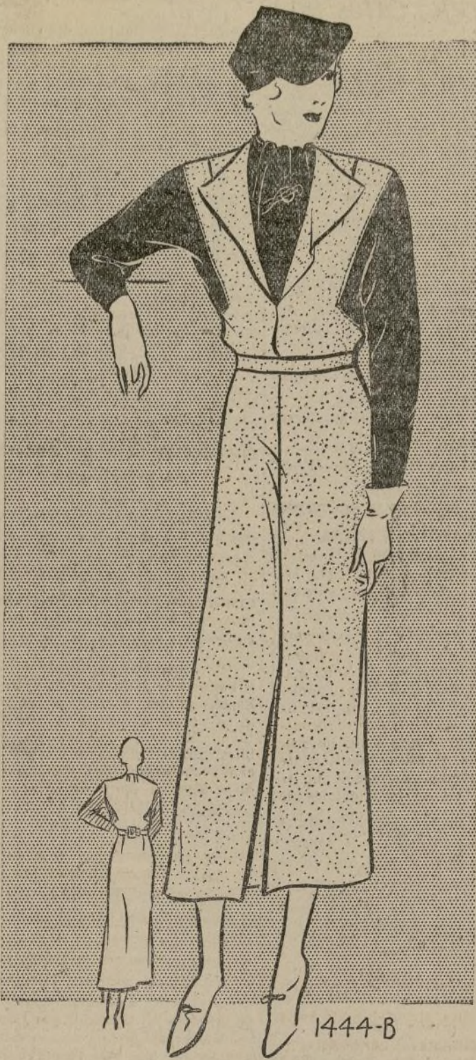
VESTIDO PARA LA CIUDAD

1444-B.—El aire casual de distinción que demuestra el modelo que presentamos hoy nos hace deseable para usar en los primeros días frescos del Otoño. Es digno de admiración el escote formando una solapa muy graciosa. Este detalle es muy nuevo y además hace juego con las mangas de estilo "dolmen" que están ejecutadas muy astutamente en una tela contrastante que hace aparentar a la dama que lo use mucho más delgada. Este vestido es una selección linda para la matrona o señora gruesa. Se usan dos colores contrastantes o crepé satén, usando el revés y el derecho. Esta última tela está muy en voga esta temporada para modelos de este estilo. El crepé se usa en la mayor parte del vestido y el satén para el adorno. También se ven otras combinaciones en lana y el adorno.