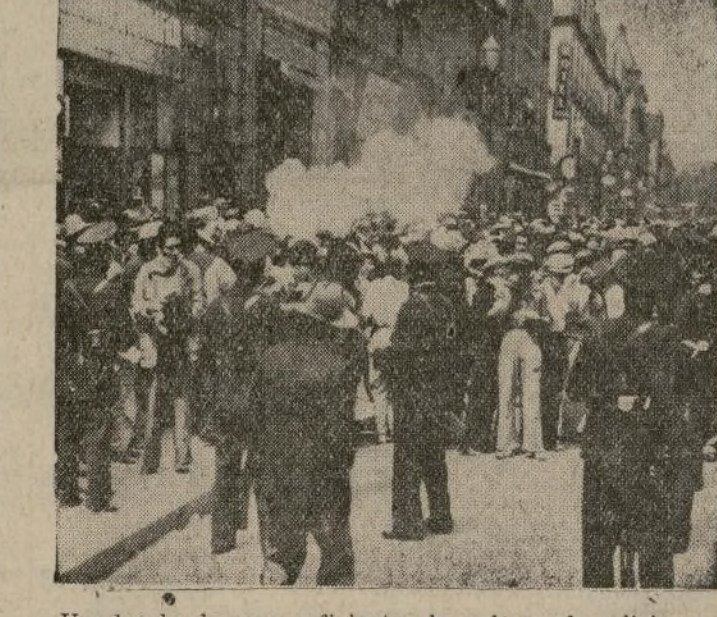
Una bomba de gases asfixiantes, lanzada por la policía en la capital de Méjico, dispersa a los participantes en un desfile de 50,000 católicos que protestan por el cierre de las iglesias por las autoridades civiles.