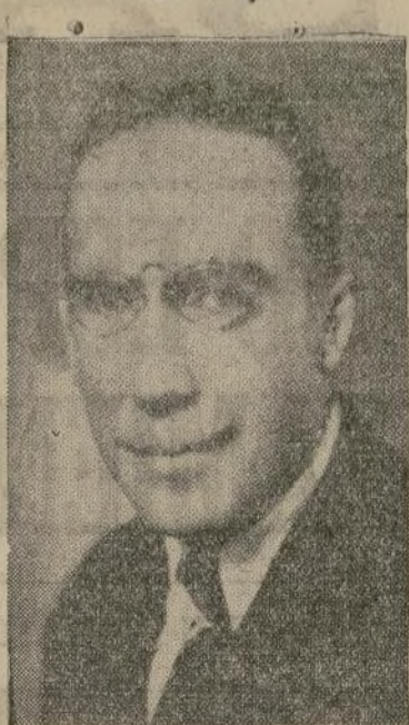
Theodore F. Green, el gobernador de Rhode Island, pidió a la asamblea general, en sesión extraordinaria, que autorizara el uso de tropas federales para sofocar los motines huelguistas, pero la legislatura desechó la petición.