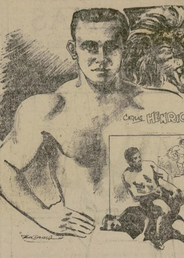
El formidable luchador hispano, que lleva el emblema leonino de su alma mater (Univ. de Columbia), hace su reaparición en breve.