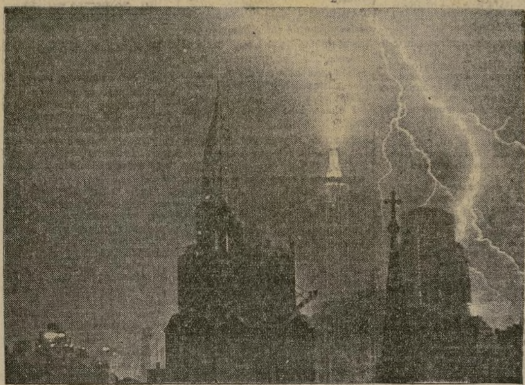
Durante una reciente tormenta un rayo pegó en la punta del Empire State Building, al mismo tiempo que otro daba en un rascacielos cercano, mientras otras centellas más pequeñas jugueteaban entre ellos.

LA NATURALEZA PRUEBA EL MAYOR DE LOS PARARRAYOS