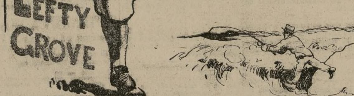
"estroqueó" a 5 bateadores con 17 pelotazos: 15 "strikes," 1 "foul," 1 bola. (Philadelphia vs. Cleveland, Agosto 23, 1928)