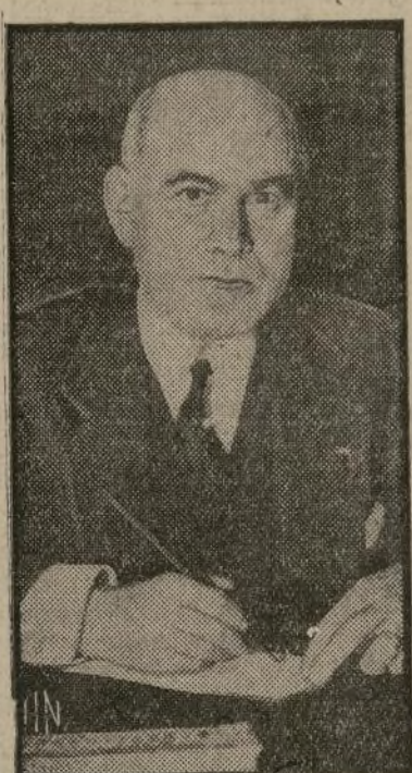
Gobernador Herbert H. Lehman

Toda la plana mayor de candidatos se repetirá en noviembre.—El ex-gobernador Smith hizo la presentación de Lehman para su re-postulación.—Adhesión incondicional al "nuevo sistema" de Roosevelt.