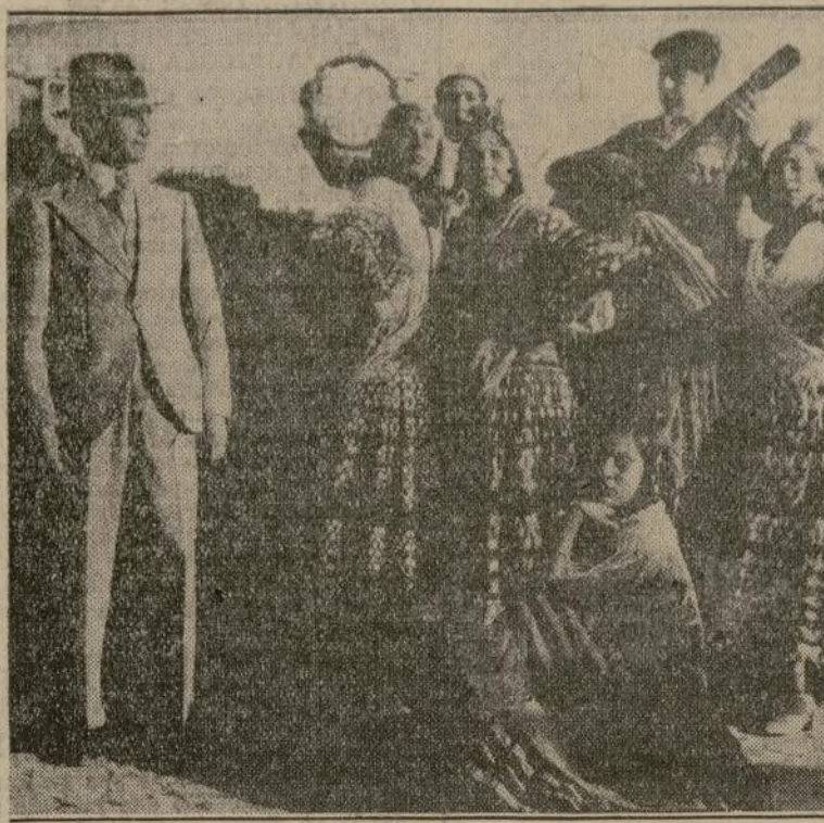
El genial Vicente Escudero, en las cuevas de Sacro Monte de Granada, entre varias de las notabilísimas bailarinas flamencas, gitanas, que le han acompañado en su viaje actual a Nueva York.

EL GENIAL BAILARIN GITANO ESCUDERO PRESENTA UN GRUPO DE CALES DE GRANADA