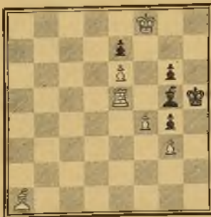
Núm. 10 PH. KLOT

ha tenido en el desarrollo progresivo de nuestro arte, el descubrimiento de la idea que al presente nos ocupa, idea que muchos creen de naturaleza asiática, siendo así que es indígena de Europa, pues procede de la privilegiada imaginación del celeberrimo Anderssen. En