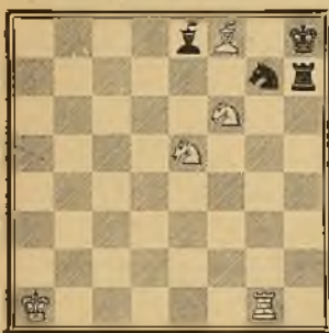
Mate en 3 jugadas

sérvese, en cambio, que los solucionistas de aquel tiempo, acostumbrados á salir siempre del laberinto por medio de jaques repetidos, debióles costar un triunfo atinar en el movimiento preciso é inofensivo del R, y en la toma del P al paso (1), maniobras completamente inusitadas hasta aquel entonces y que constituyen el quid de la solución en los problemas 6 y 7 del texto.