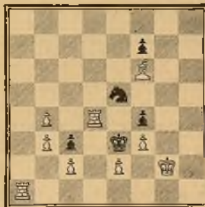
Mate en 3 jugadas

resolverlo; por la noche, los esfuerzos combinados de esos adalides no habían obtenido resultado, y sólo dos de ellos persistían al día siguiente en sus trece, sin hallar la solución del enigma. Calvi empleó la noche entera, y al despuntar el día era vencedor. ¡Pero á costa de cuántos esfuerzos! ¡¡Había agotado todas las combinaciones posibles!!» Añadiremos de nuestra propia cosecha que del problema indio han nacido los procedimientos llamados de ataque y de bloqueo, los cuales han originado á su vez aquella ley de construcción que el autor de estas líneas