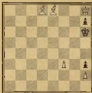
Núm. 9 ANDERSSSEN (1843)