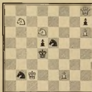
104 F. ESCUDE