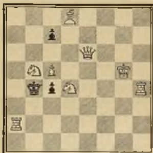
100 PEDRO RIKHA