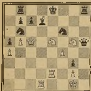
Estilo antiguo Núm. 11 STAMMA (1737)

zontes, pues no presentan variantes; es cierto, también, que los procedimientos empleados por el autor del planteo número 13 son anticuados, y que la jugada 1 T 7 D, propia de la composición n.º 14, además de impedir el único movimiento permitido al Rey negro, amenaza 2 C 6