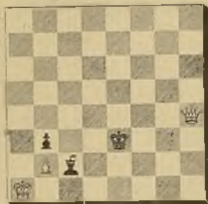
Núm. 11 E. ESTORCH