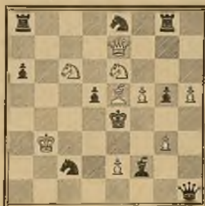
Estilo moderno Núm. 12 J. RINGER (1884)

Solución: 1 D 8 R+—R X D; 2 C 6 C+—R 1 D; 3 C 7 A+— R 1 A; 4 C 7 R++.