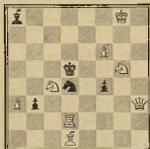
103 EMILIO PRADIGNAT