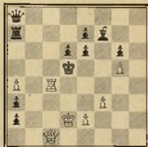
102 VALANTÍN MARÍN