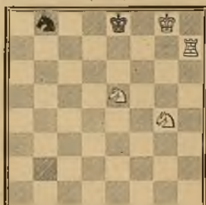
Estilo de transición Núm. 14 ALFREDO DE MUSSET (1850)

Solución: 1 D 4 A+—R 7 D; 2 D 1 A+—R X D; 3 C ++.