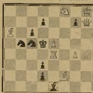
116 EMILIO PRADIGNAT