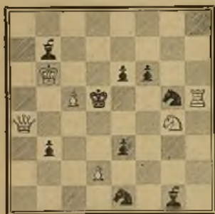
121 Lema: Acta est fabula