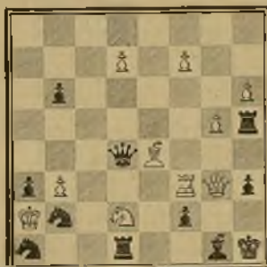
122 Lema: Ad vitam aut culpam