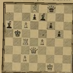
133 Tema: que un diamante