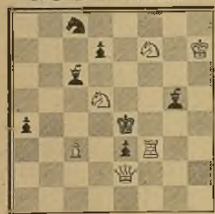
125 Lema: Renovata