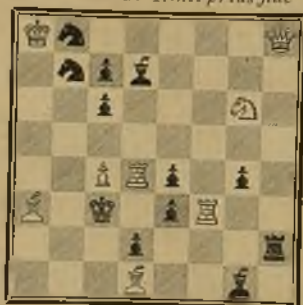
129 Lema: Nihil prius fide