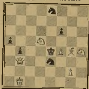
131 Lema: Daleká cesta