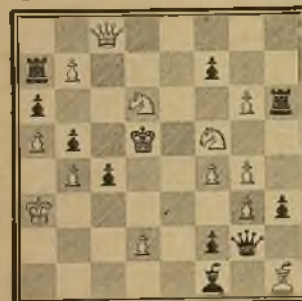
127 Lema: Mater dolorosa