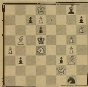
123 Lema: Nux e terra parva