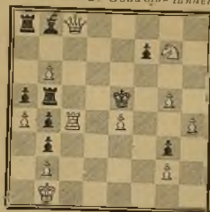
132 Лема: Ououennu tandem