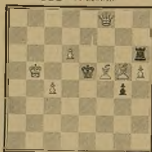
115 V. MARÍN