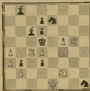
124 Lema: Ave