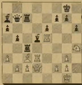
16 Ag. Gómez

1 T de 3 D×A P×T y las blancas anunciaron mate en 4 jugadas