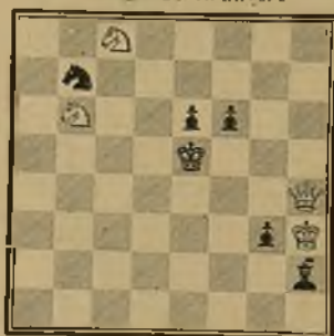
135 Tema: Bruneri