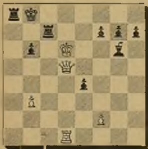
15 F. Escuté

Las blancas juegan y dan mate en 3 jugadas