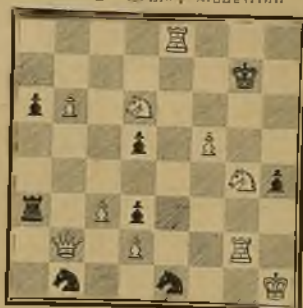
130 Lema; Modestino