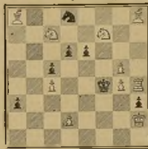
126 Lema: ¿In hoc signo vinces?