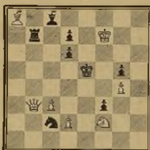
138 V. MABIN