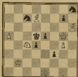
140 HERMANN KVIDANCEK