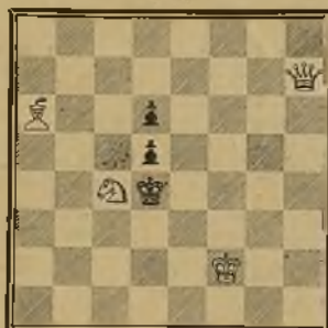
139 P. G. L. F.