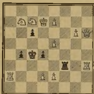
137 EMILIO PRADIGNAT