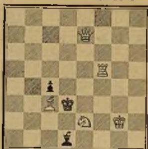
172 OTTO WURZBURG