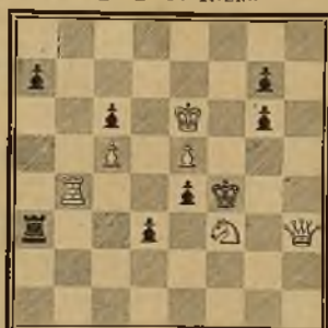
174 P. RIEHA