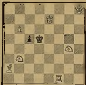
171 EMILIO PRADIGNAT