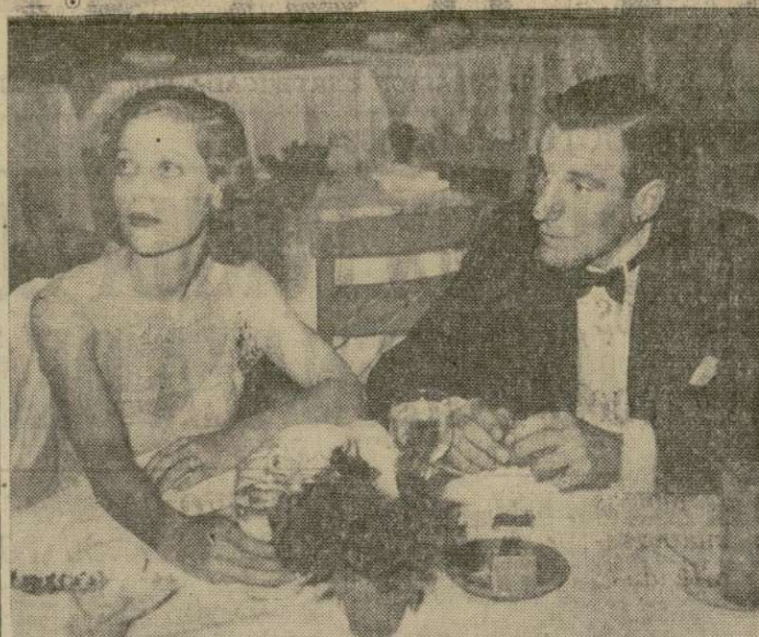
He aquí a Fred Perry, el primer tennista del mundo en estos momentos, con Loretta Young, durante una fiesta de artistas en un cabaret de Hollywood, Cal. Se dice que una compañía cinematográfica desea presentar al deportista inglés, cuya excelente dición y apuesta figura le harían una estrella ideal.