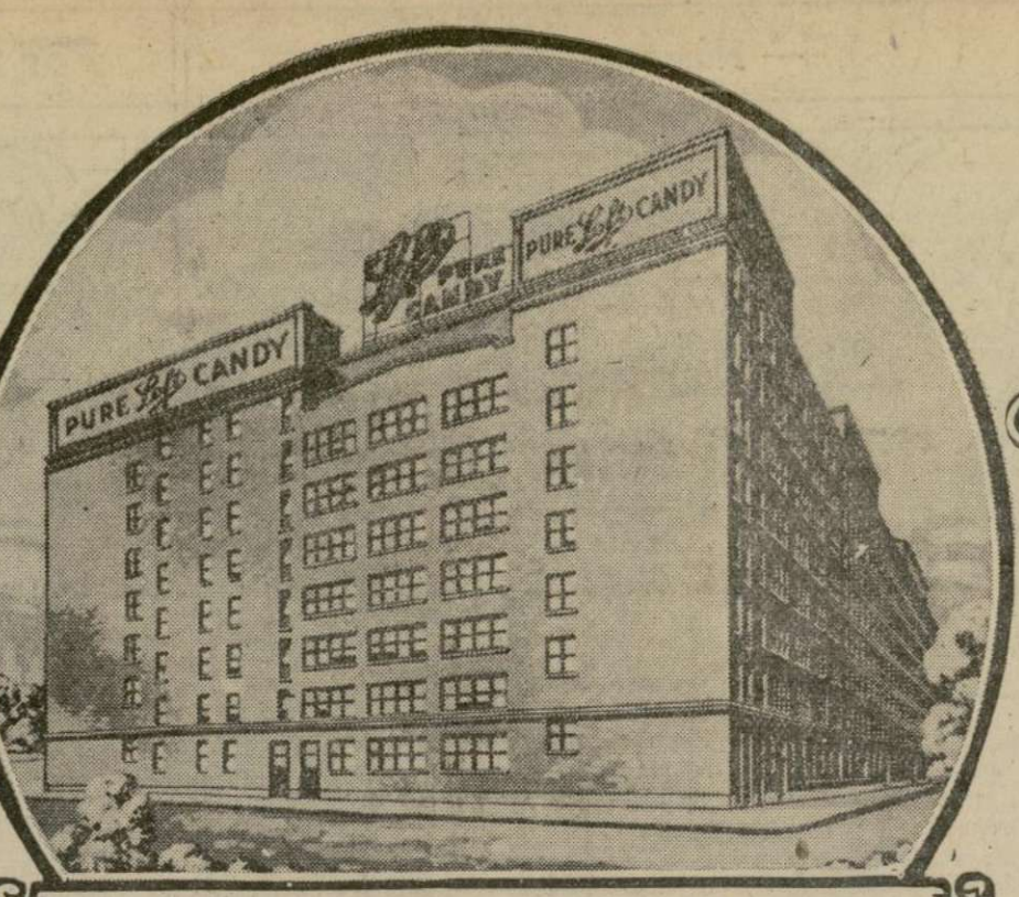
La fábrica de confites más grande del mundo— Donde se fabrican los Confites Puros de Loft

Proyectase interrogar a los obreros que hicieron las instalaciones del barco para determinar si los supuestos defectos eran intencionales o accidentales.