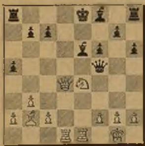
Núm. 52 POLLOCK