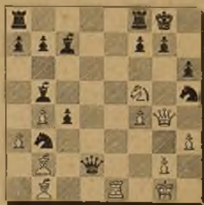
Núm. 53 TARRASCH