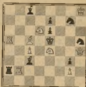
349 2.º Premio G. HAYMOLE