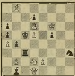
343 J. JESPERSEN