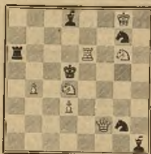
346 1.º Premio P. J. MARAKELIN