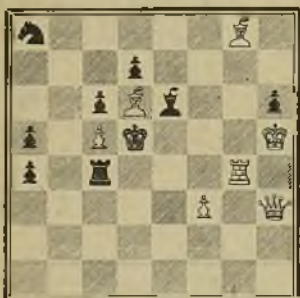
342 J. JESPERSEN