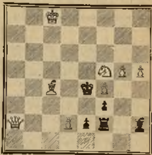
3.º Premio. — E. TAGALA

Solución: 1 D 4 T — R X C1 2 A 6 R + — R X A; 3 D + 7 Sl... P 8 R (D); 2 A 1 A + d., etc. Sl... A X P; 2 D 2 A + etc. Sl... R X P; 2 A 3 D + etc. Sl... cualquiera otra; 2 A. 5 C + d. etc.