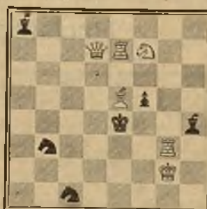
347 2.º Premio P. F. BLAKE