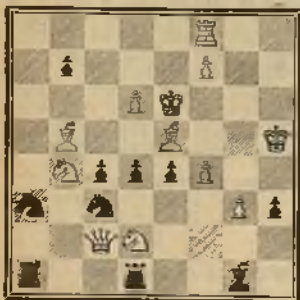
4.º Premio. — M. FEIGL

Solución: 1 C3 C — P X C; 2 A2 R1 — C X A; 3 D8 A7; Si... P6 D; 2 D2 T R1! — A X D; 3 C7 + Si... P3 C; 2 A6 T etc. Si... cualquiera otra! 2 C5 A7 etc.