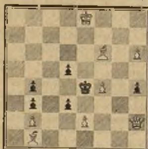
344 L. VIANELLO (inédito)