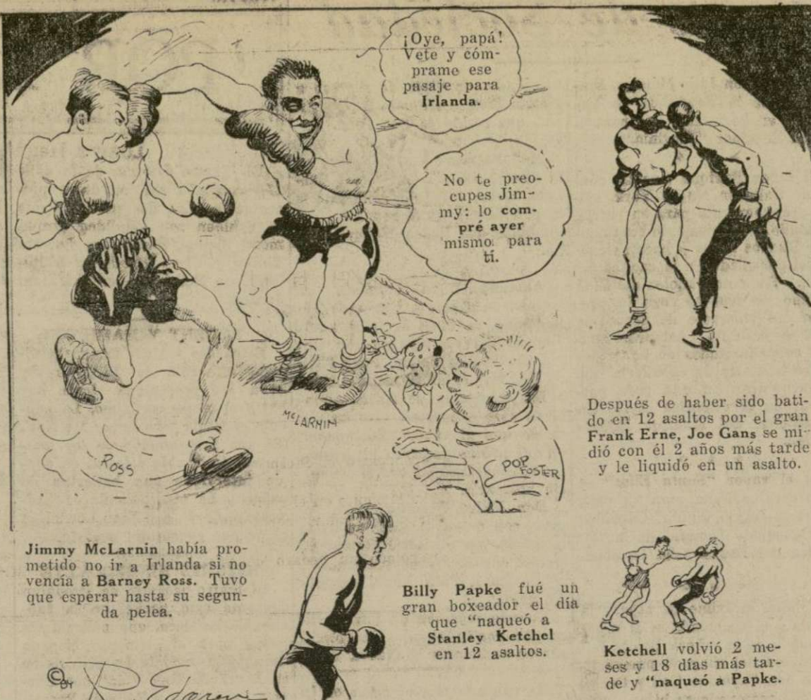
Jimmy McLarnin había prometido no ir a Irlanda si no venía a Barney Ross. Tuvo que esperar hasta su segunda pelea.

Billy Papke fue un gran boxeador el día que "naqueó" a Stanley Ketchel en 12 asaltos.