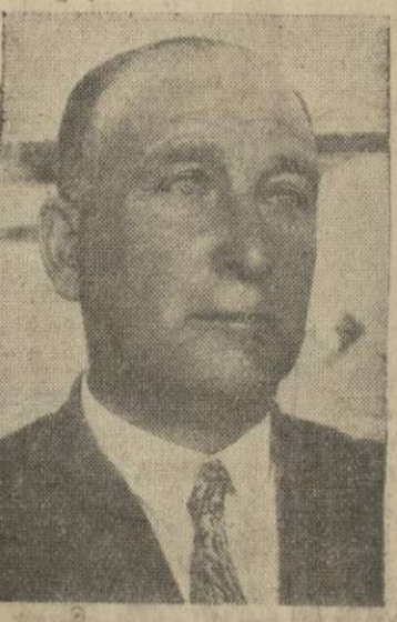
D. Francisco Largo Caballero