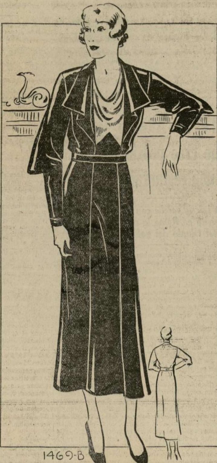
VESTIDO DE TARDE PARA SEÑORA GRUESA

1469-B. — Toda dama gruesa, con tantas aspiraciones de aparentar delgadez, notará que la péndula de la moda está balanceándose en su dirección esta temporada. Este modelo reúne las cualidades todas que favorecen la silueta de la señora gruesa: línea sobria, sencillez y elegancia.