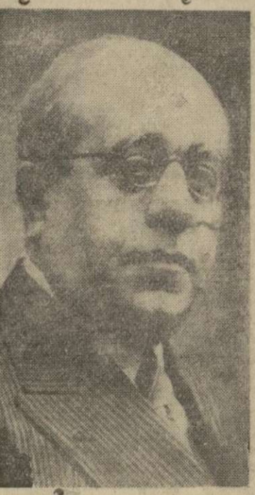
D. Manuel Azaña