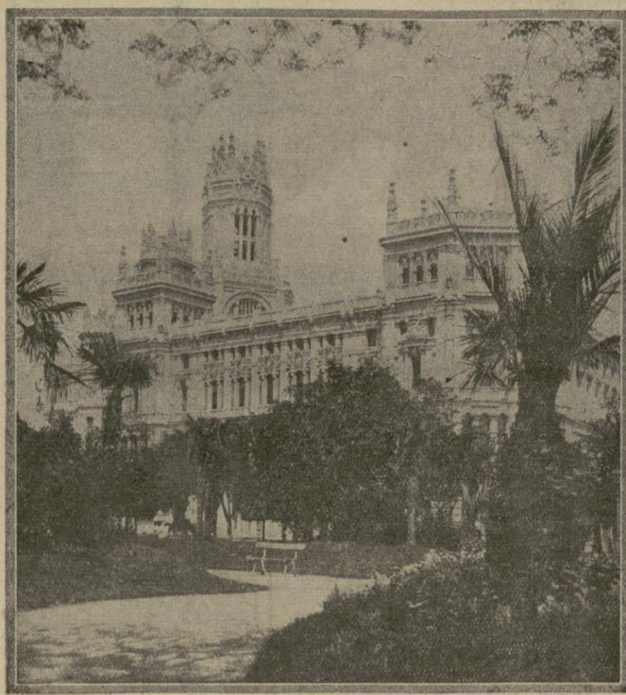
El magnífico edificio del Ministerio de Comunicaciones, en la Plaza de La Cibeles, blanco de varios ataques por los revolucionarios ayer, y tenazmente defendido por las tropas del gobierno.