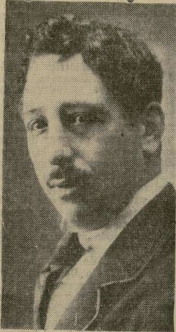
D. Luis Companys

En un comunicado oficial, expedido a raíz de la celebración de un Consejo de emergencia que celebró anoche el presidente Antonio Salazar con su Gabinete, se dice que el gobierno está observando con toda atención las incidencias de la rebelión española y (sigue en la sexta página)