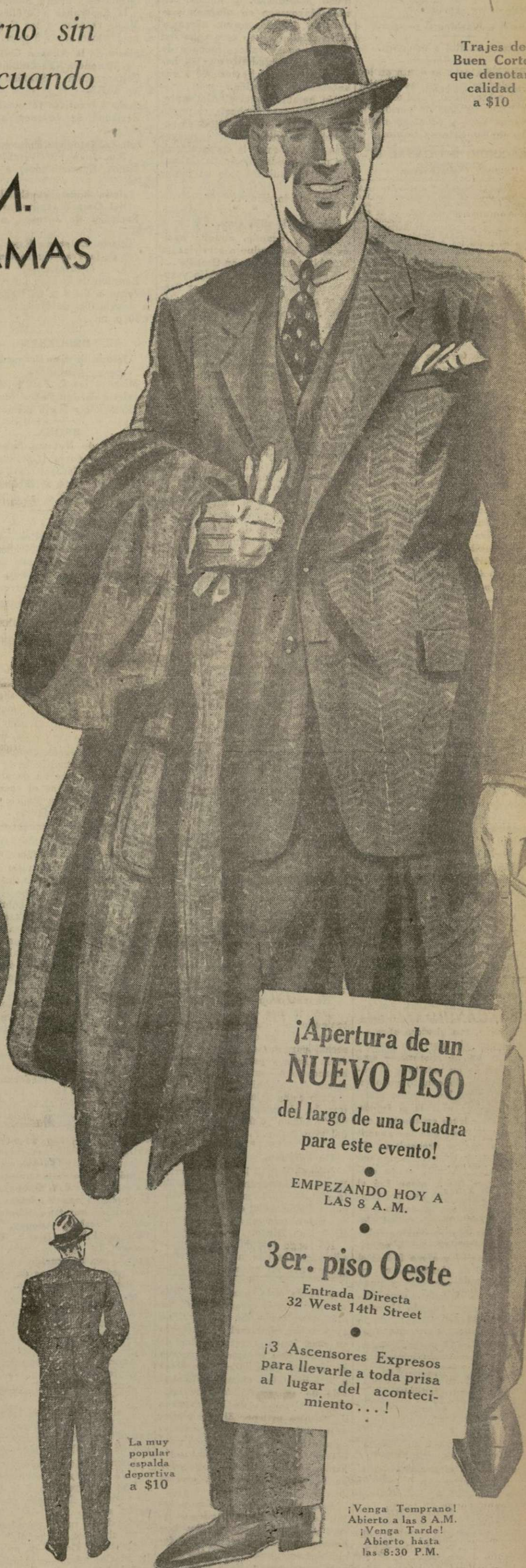
Trajes de Buen Corte que denotan calidad a $10

Una tremenda compra al contado. ADEMÁS de meses de preparación por expertos en ropa. ADEMÁS de la cooperación de un gran fabricante, y de los más grandes talleres de tejidos en América. Ellos cedieron parte de SUS ganancias. Y nosotros cedimos TODA NUESTRA PARTE — para hacer posible este evento. No sólo "una venta" de ropa. No podíamos haber sido más quisquillosos en la calidad, estilo y mano de obra de estas prendas, hubiésemos contemplado venderlas de $25 a $30. Todos los detalles asegurados. Y cada prenda garantizada 100%.