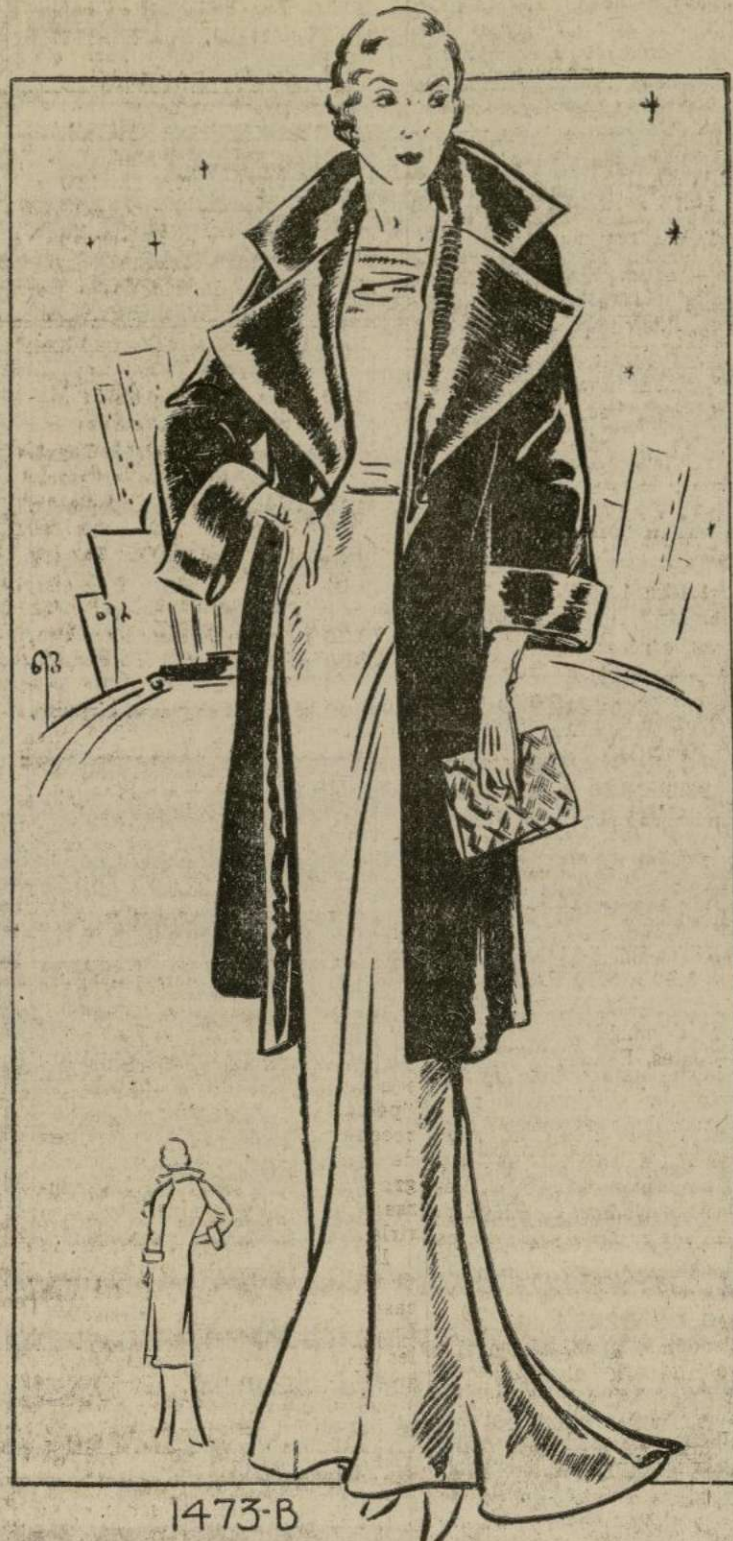
TAPADO PARA NOCHE

1473-B.—Este invierno, toda dama que asista a reuniones de etiqueta se deleitará en poseer un abrigo como el que ilustramos hoy. Este resulta muy práctico y cómodo para salir de noche.