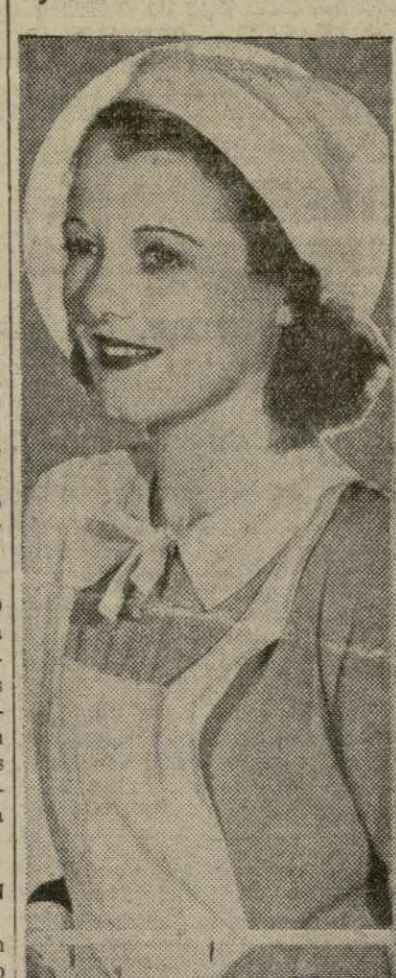
Bajo la toca blanca, brillan sus ojos con un dulce mirar de candidez sencilla. Es Janet Gaynor en "Servant Girl".

Cantor ha hecho "negros" para la pantalla y hasta en "Madame DuBarry" hay un "negrito" en el séquito de la celebrada cortesana. En España el "gallego" parece ser el tipo cómico y en las Antillas, particularmente en Cuba, el negrito y la mulata.