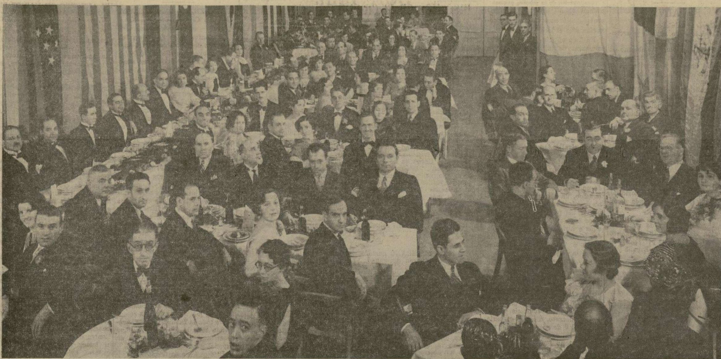
Con la brillantez de costumbre se celebró el sábado por la noche el banquete-baile que esta sociedad española verifica todos los años para festejar la memorable fecha del descubrimiento de América. Al acto asistieron representantes de varios consulados de la raza, agrupaciones, y conocidos miembros de nuestras colonias que disfrutaron una excelente noche, en castizo ambiente nuestro.

MADRID, España, octubre 14 (UP).—Circula hoy el rumor de que don Rafael Salazar y Alonzo, exministro del Interior, cuyas medidas previas hicieron posible la sofocación de la revolución socialista, será nombrado dentro de poco alcalde de Madrid.