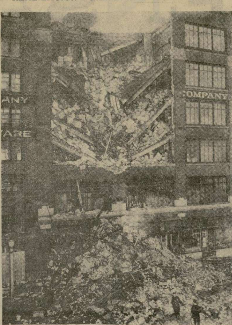
Establecimiento de venta al por mayor de víveres que se derrumbó en Takoma por haberse reventado una cañería de agua en el piso superior que reblandeció los muros, cayendo a la calle las mercancías y muebles.