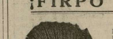
Luis Angel Firpo.

El "Toro Salvaje de las Pampas" lleva meses entrenándose en una hacienda, lejos de Buenos Aires, para lo que va a constituir su tan anunciado retorno al "ring".