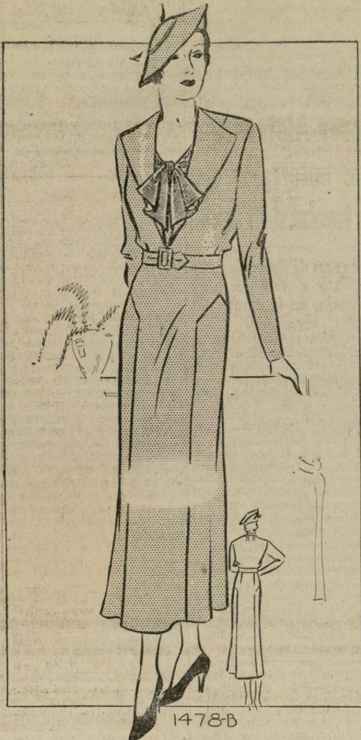
VESTIDO DE CALLE

1478-B.—El vestido del dibujo a la parte baja de la falda sin sacrificar la silueta de esta temporada. Los colores más favoritos para este invierno son el negro, castaño, verde oscuro, ciruela y púrpura. El "Cantón" está muy en boga para vestidos de tarde, así como también el crepé satén, lana y otras varias telas sintéticas. El pecherín se puede hacer de seda o de encaje fino.