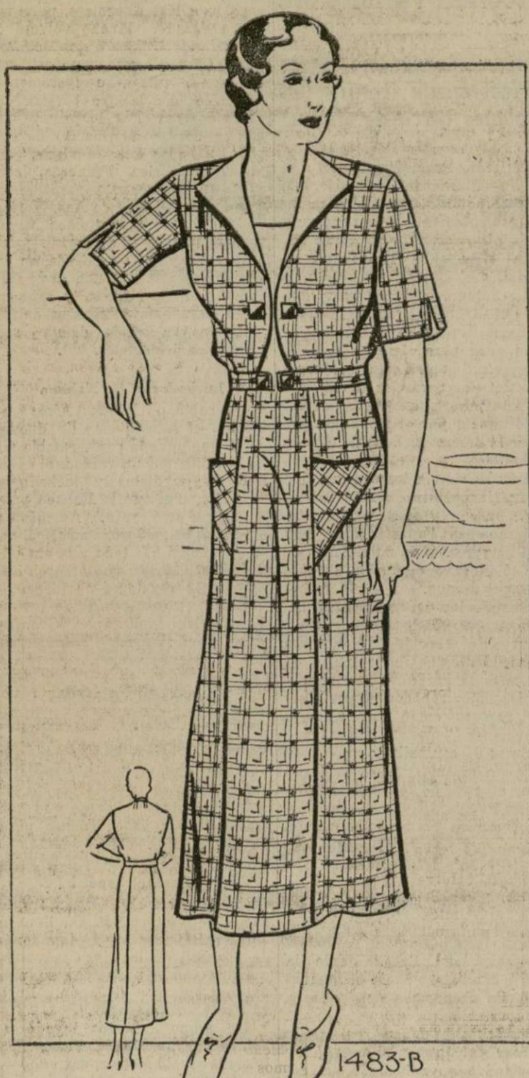
VESTIDO DE CASA

1483-B. — Ninguna señora de casa deja de conocer que para desempeñar los quehaceres domésticos con gusto, es necesario tener los vestidos apropiados. Deben ser confortables, atractivos y lo suficientemente versátiles para afrontar a las exigencias de las tareas de casa. Toda dama de casa le gusta aparentar tan bien, cuando limpia el ático, como cuando sale a contestar el timbre de la puerta. Este modelo está confeccionado en percal estampado, muy bonito. El percal se hace de tela blanca, que sienta admirablemente bien a la cara. Este percal es muy servicial y práctico, porque no se ensucia con facilidad y plancha divinamente bien.