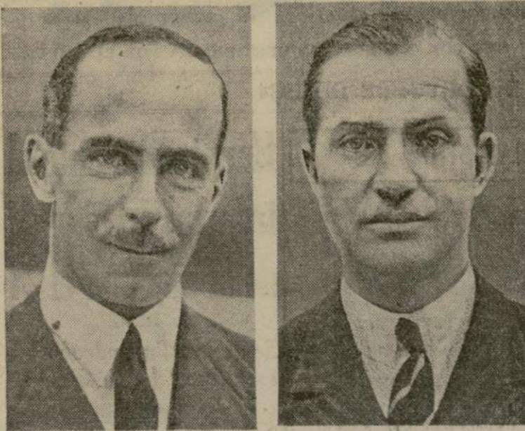
T. Campbell Black (izquierda) y C. W. A. Scott, aviadores británicos, quienes, aventajando a todos los demás competidores en el Derby Aéreo Internacional de Londres a Melbourne, llegaron a Australia con gran delantera sobre los dos holandeses y sobre el capitán Turner y Clyde Pangborn, americanos.