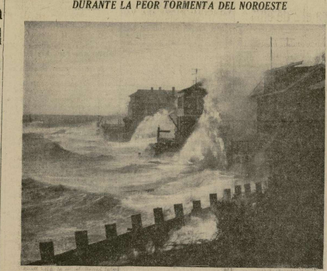
Las olas del Pacífico se ensañan contra Magnolia Bluffs, cerca de Seattle, durante el vendaval de 80 millas por hora que causó enormes daños a la navegación y a los edificios a lo largo de la costa.

Los estadounidenses consideran que el reconocimiento del principio de igualdad significaría abrir las puertas a idénticas peticiones por parte de otras potencias.