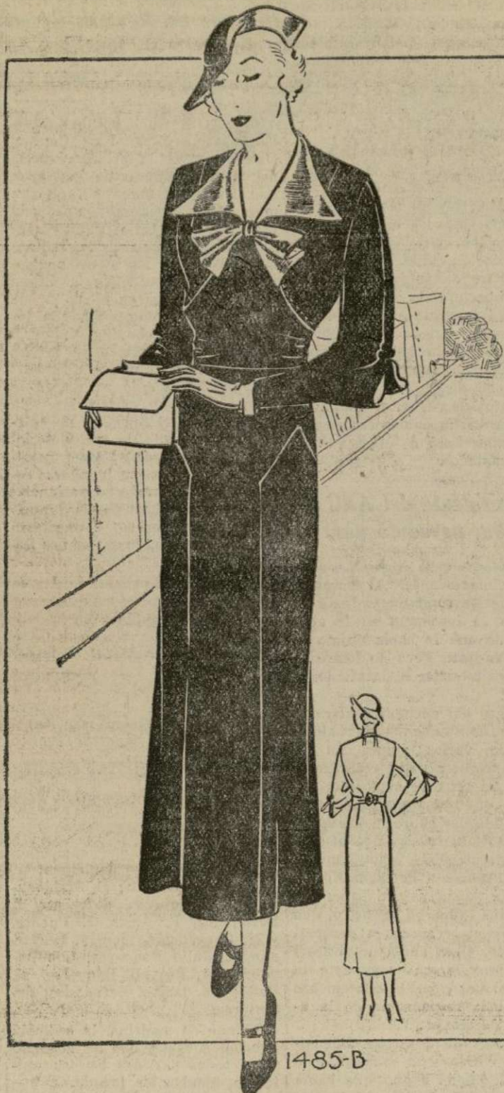
ELEGANTE VESTIDO PARA MATRONA

1485-B. — El modelo que presentamos hoy es algo diferente a los que con regularidad se ven para señoras gruesas. En primer lugar no tiene cinturón, algo que favorece muchísimo a la figura gruesa. El estilo de este traje adelgaza la silueta. Los paneles de la falda hacen aparentar la falda más angosta. La cintura, como se verá en todos los modelos de este año, se moldea graciosamente al cuerpo. Las mangas son muy atractivas, señadas hacia el puño, con un corte muy gracioso en el codo. Este estilo de manga realza el vestido, y se ve mucho en los vestidos de matrona. Este modelo estará muy lindo confeccionado en crepé de lana negro, con satén en las solapas y lazo.