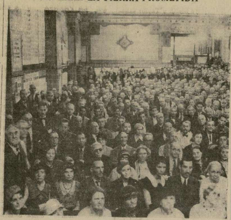
Parte de la multitud reunida para oír los discursos de campaña en el centro de operaciones del "EPIC" de Upton Sinclair, en Los Angeles. Al salir, todos firmaron una solicitud de trabajo en el "EPIC" para cuando Sinclair fuera elegido.

IVAN MIHAILOFF FUE PRESO EN ESTAMBUL A PETICIÓN DE SOFIA