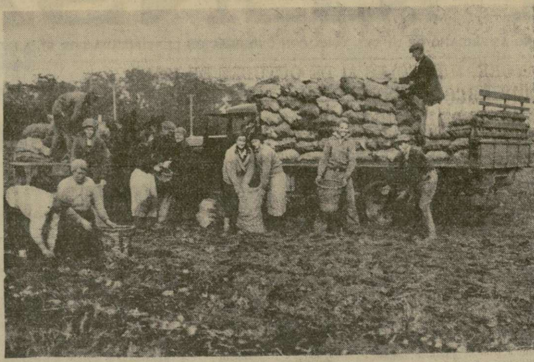
La cosecha de patatas en Long Island, N. Y., es ensacada para que la N. Y. State Temporary Emergency Relief Administration, que ha hecho arreglos para la compra de 100,000 bushels, pueda llevarla para distribuirla entre las familias pobres de la metrópoli.