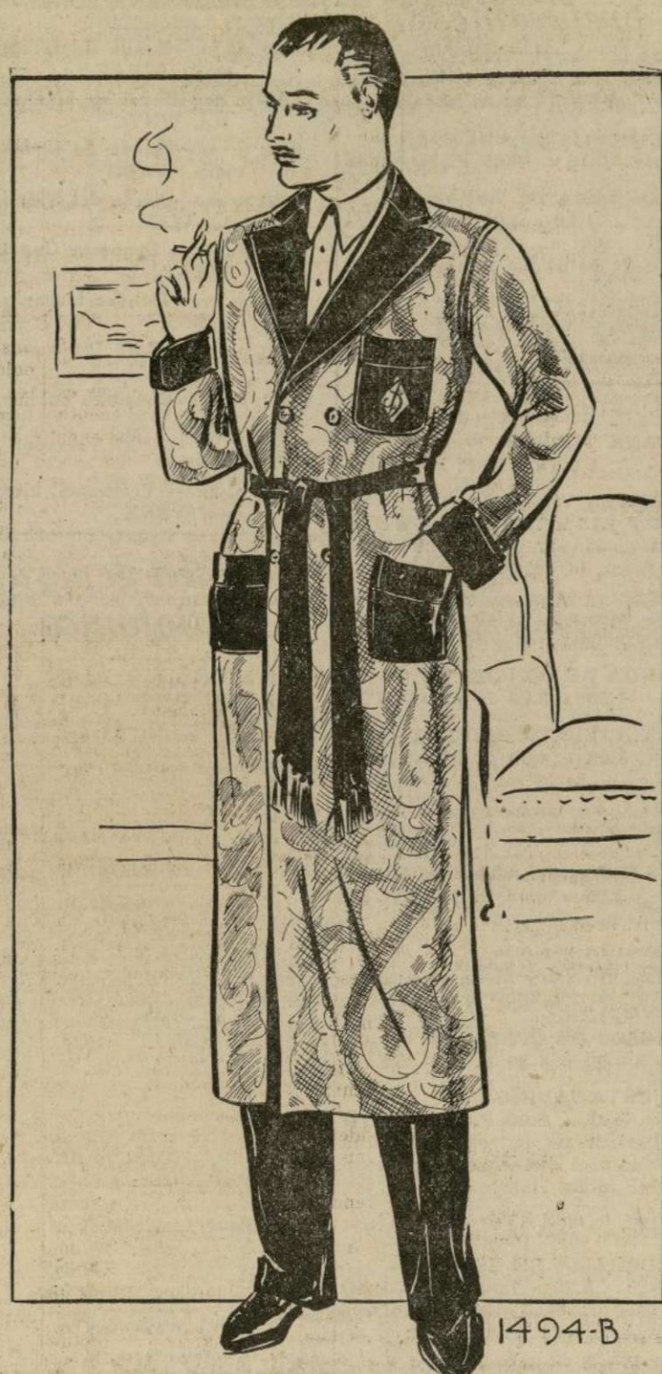
BATA PARA CABALLERO

1494-B.—Una tienda de caballeros recientemente tuvo una exhibición de ropa, para orientar a las damas sobre qué regalo de Navidad agrada más a los hombres. Entre varias de las cosas que más gustaron se encontraba el modelo que presentamos hoy. Los había en distintas telas. Con este patrón incluimos las instrucciones necesarias, de manera que si las sigue, podrá conseguir una bata de estilo elegante y apariencia profesional. Las modas de las batas no cambian mucho de año en año. Si no fuera por las distintas telas que se usan en ellas, casi todos los hombres se verían iguales. Este