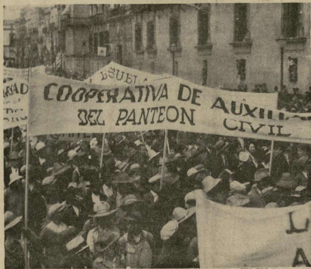
Parte de la manifestación formada por 150,000 trabajadores y empleados que desfilaron en la capital de Méjico para expresar su aprobación respecto al programa del gobierno sobre educación socialista y expulsión de los sacerdotes católicos, después de que los más altos prelados de la iglesia fueron acusados de sedición.