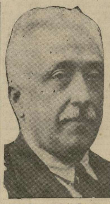
Don Niceto Alcalá Zamora