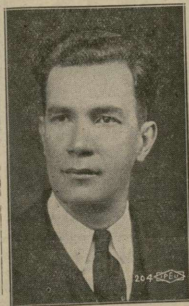
Candidato a la Asamblea por el Distrito número 17

Dispáranse los últimos cañonazos en la campaña política que se está llevando a cabo en el sector hispano del distrito asambleístico número 17 en el cual ha sido postulado un puertorriqueño para el puesto de Asambleista a Albany por el partido Republicano.