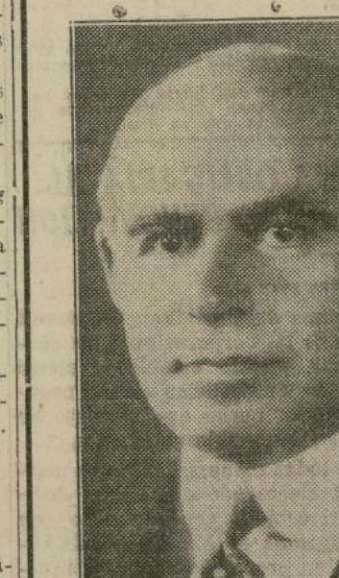
HERBERT H. LEHMAN