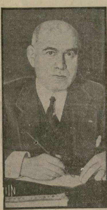
Gov. Herbert H. Lehman