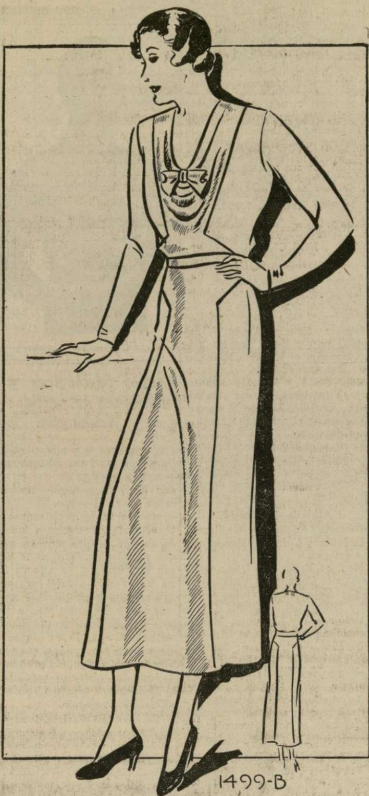
VESTIDO PARA DAMA GRUESA

1499-B. — El modelo que presentamos hoy es de corte irreprochable y líneas prolongadas y esbeltas. Cualquier costurera principiante podrá realizar un vestido elegante con este patrón. Este traje está adecuado para usar por la tarde para asistir a matines, "bridge", té o almuerzo. El estilo es elegante; cualquier dama elegante se sentirá orgullosa de poseer uno o dos de éstos. Este se puede realizar en crepón-satin, usando el crepón para el vestido y el satin para el adorno. También se puede usar el crepón Cantón o el terciopelo. Este último se puede conseguir suave y transparente, así como también más fuerte. Las telas de moiré con motitas plateadas y de oro le dan un efecto