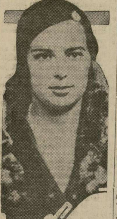
La ex Infanta Beatriz

tiene 25 años, es la hija mayor del antiguo monarca español. Hace más de dos años se anunció su compromiso matrimonial con su primo segundo, don Alvaro de Orleans, anulándose más tarde. Después corrieron rumores de que el duque de Spoleto, primo del rey Víctor Manuel, quería casarse con la infanta doña Beatriz.