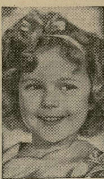
La pequeña artista Shirley Temple en una escena de "Now and Forever", que se exhibe en los teatros Regent y Hamilton.