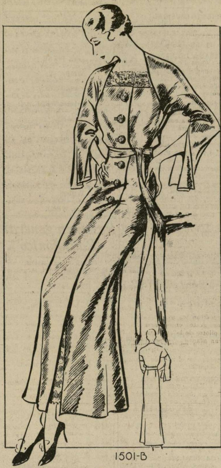
ELEGANTE DESHABILLE PARA REGALAR EN LAS NAVIDADES

1501-B.—El patrón de hoy es una magnífica sugerencia para aquellas personas que acostumbran regalar en las Navidades. Este modelo es de estilo femenino y corte sumamente exquisito.