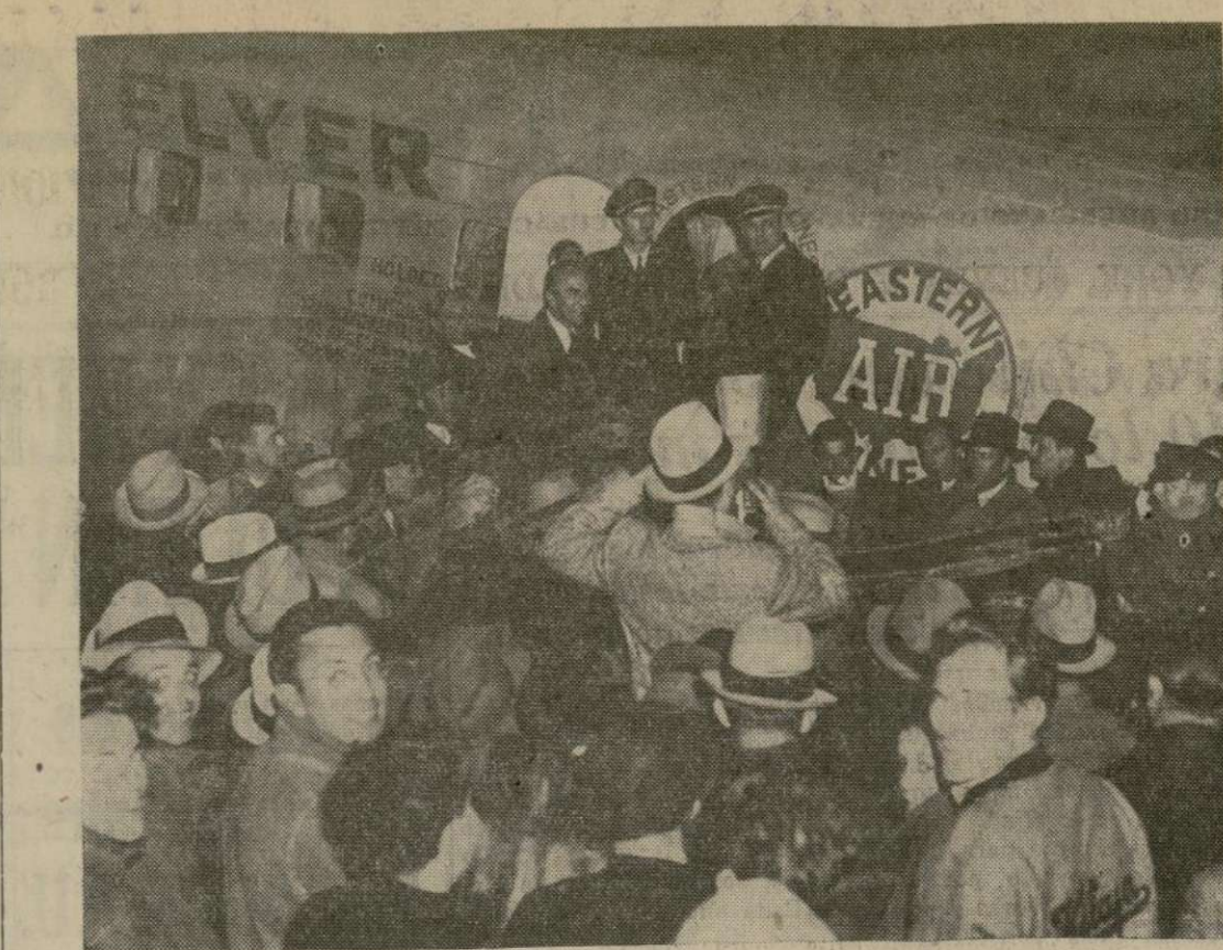
El capitán Eddie Rickenbacker, que en un mismo día tomó desayuno en Nueva York, almorzó en Miami y cenó en Nueva York, aparece aquí al lado de sus dos pilotos al descender del "Florida Flier" en el aeropuerto de New Ark después de su viaje redondo de 2,390 millas. El tiempo total del viaje fué de 17 horas y 18 minutos.