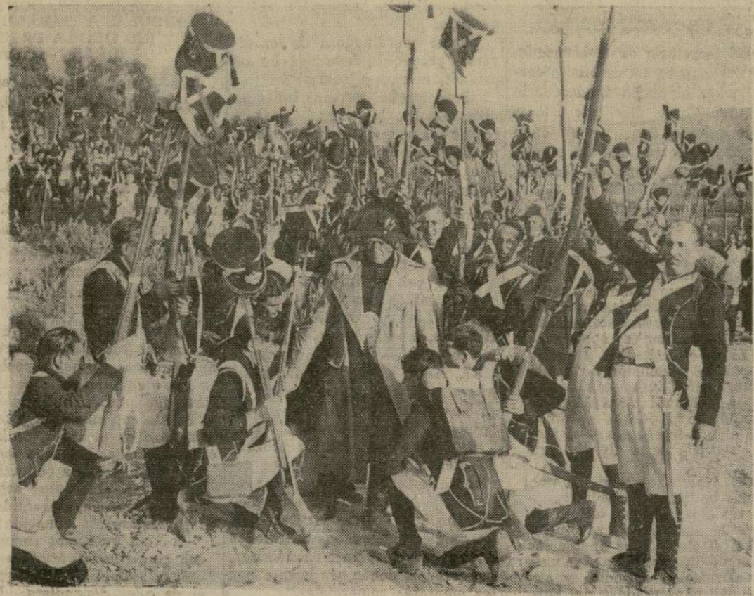
Escena tomada de la versión cinematográfica del libro de Mussolini "Los Cien Días," que fue producida por dos compañías al mismo tiempo, una alemana y otra italiana, en la isla del destierro, donde tuvieron lugar algunos de los acontecimientos que precedieron la vuelta de Bonaparte y su derrota en Waterloo.