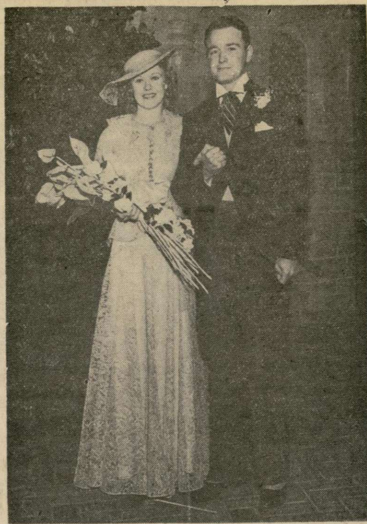
Virginia Katherine McMath y Lewis Frederick Ayer, conocidos ante los millones de asistentes al cine como Ginger Rogers y Lew Ayres, aparecen aquí en el momento de salir de la Little Church of the Flowers, en Glendale, California, después de su matrimonio.