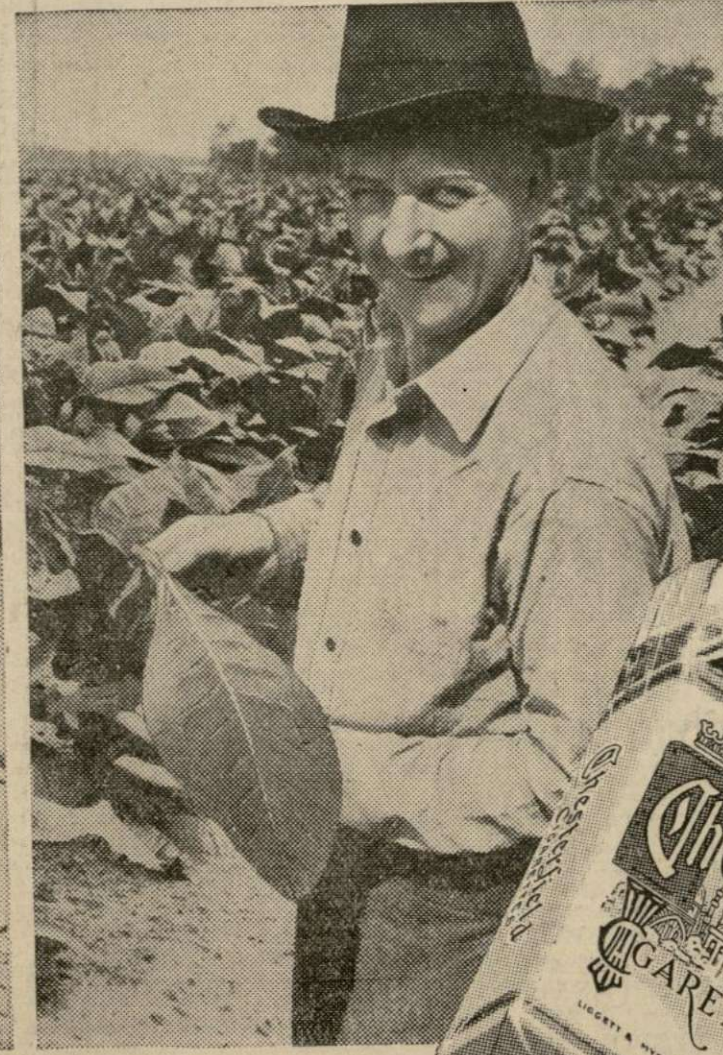
Hojas de tabaco norteamericano, suave y madurado, empleado para la elaboración de los cigarrillos Chesterfield.