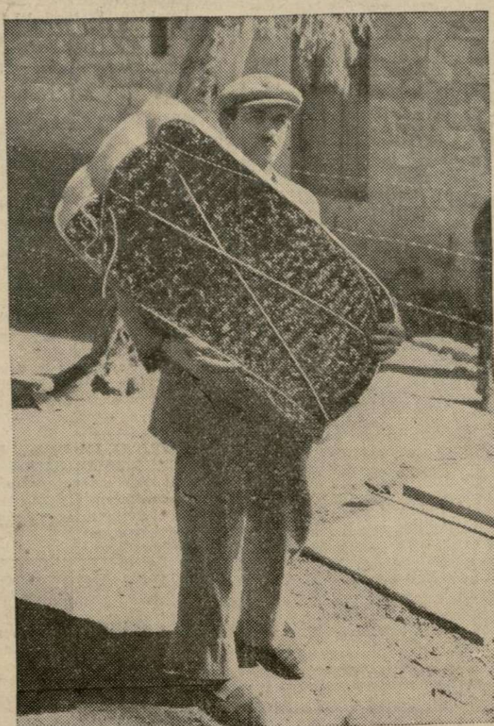
Una paca de tabaco turco aromático para el Chesterfield.

En la región del Sur de los Estados Unidos, donde se cosechan y conocen los tabacos — el Chesterfield mayormente goza de preferencia general.