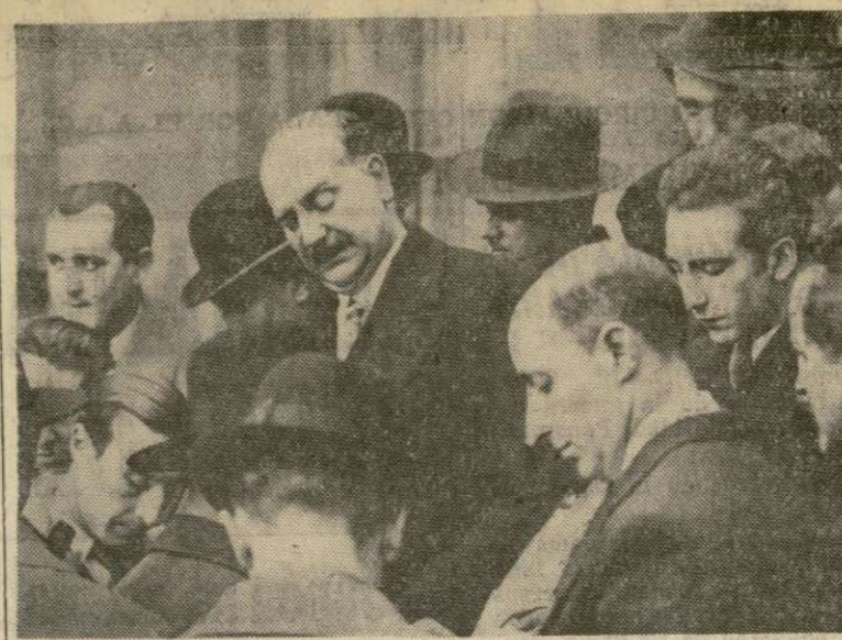
Pierre Etienne Flandin, quien a la caída de Doumergue formó el nuevo ministerio francés, indica a los periodistas de París, después de su primera visita al presidente Lebrun, que existían amenazas de dictadura en Francia.