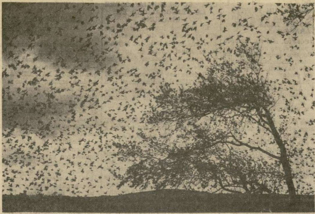
Cientos de estorninos, detenidos por los ventarrones que soplan desde el mar, revolotean desconcertados por sobre los pantanos de Pembrokeshire, cerca de Fishguard, Wales, esforzándose por salir en su vuelo migratorio hacia el mar.

Se esperan pronto nombramientos de nuevos ministros