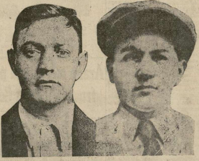
"Dutch" Schultz y "Baby Face" Nelson.