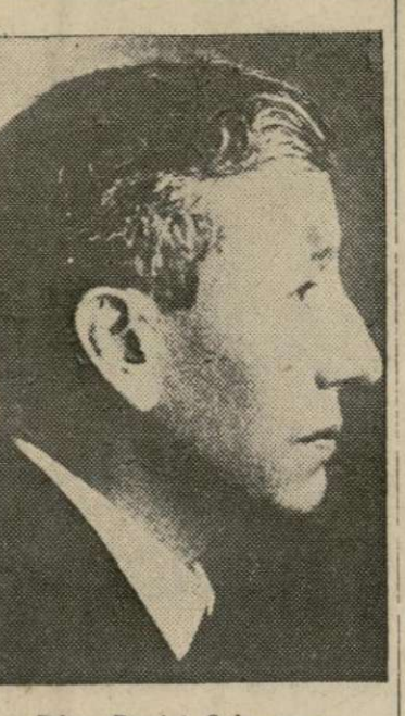
Pdte. Daniel Salamanca