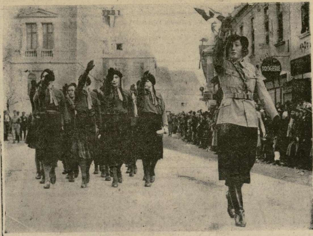
Muchachas miembros del “Ejército Juvenil” de la República, que tomaron parte en una revista de todas las unidades de las diversas organizaciones militares y atléticas del Norte de Austria, en Turin, desfilan frente a la tribuna del canceller Schuschnigg.