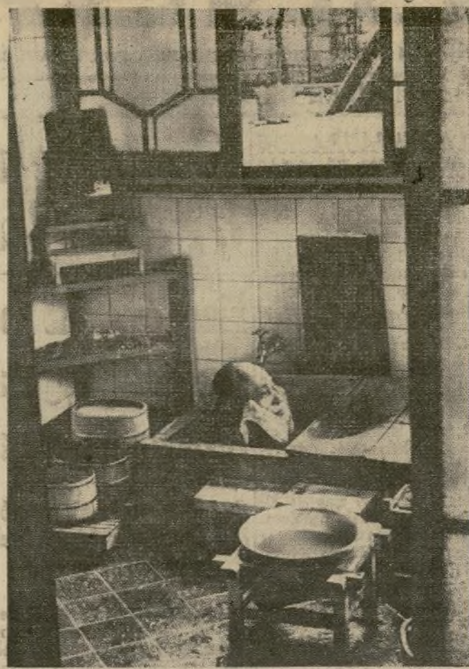
El señor de aspecto cadavérico que se ve aquí metido en lo que parece un tanque de lavar platos, es un huésped de un hotel del Japón, y lo que hace es tomar un baño antes de la cena en un cuarto de baño en que están combinados los últimos adelantos occidentales de instalación con las antiguas ideas respecto al método de bañarse.