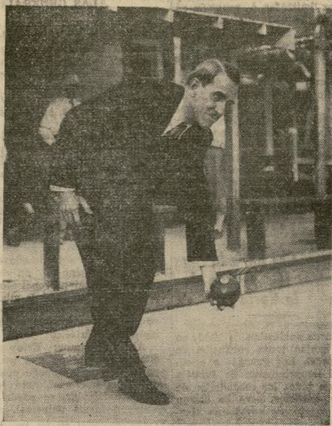
El doctor Ramón Grau y San Martín, presidente de Cuba a raíz de la caída de Gerardo Machado, jugando a los bolos en St. Petersburg, Fla., donde pasa sus vacaciones y espera el resultado de las elecciones de su país. El doctor Grau San Martín pide que el actual presidente Carlos Mendieta renuncie antes de las elecciones.