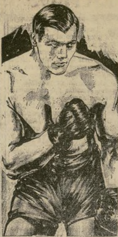
Víctorio Cámpolo y Primo Carnera, los protagonistas del "Combate de los Trogloditas" que se verificará hoy en Buenos Aires, Argentina.