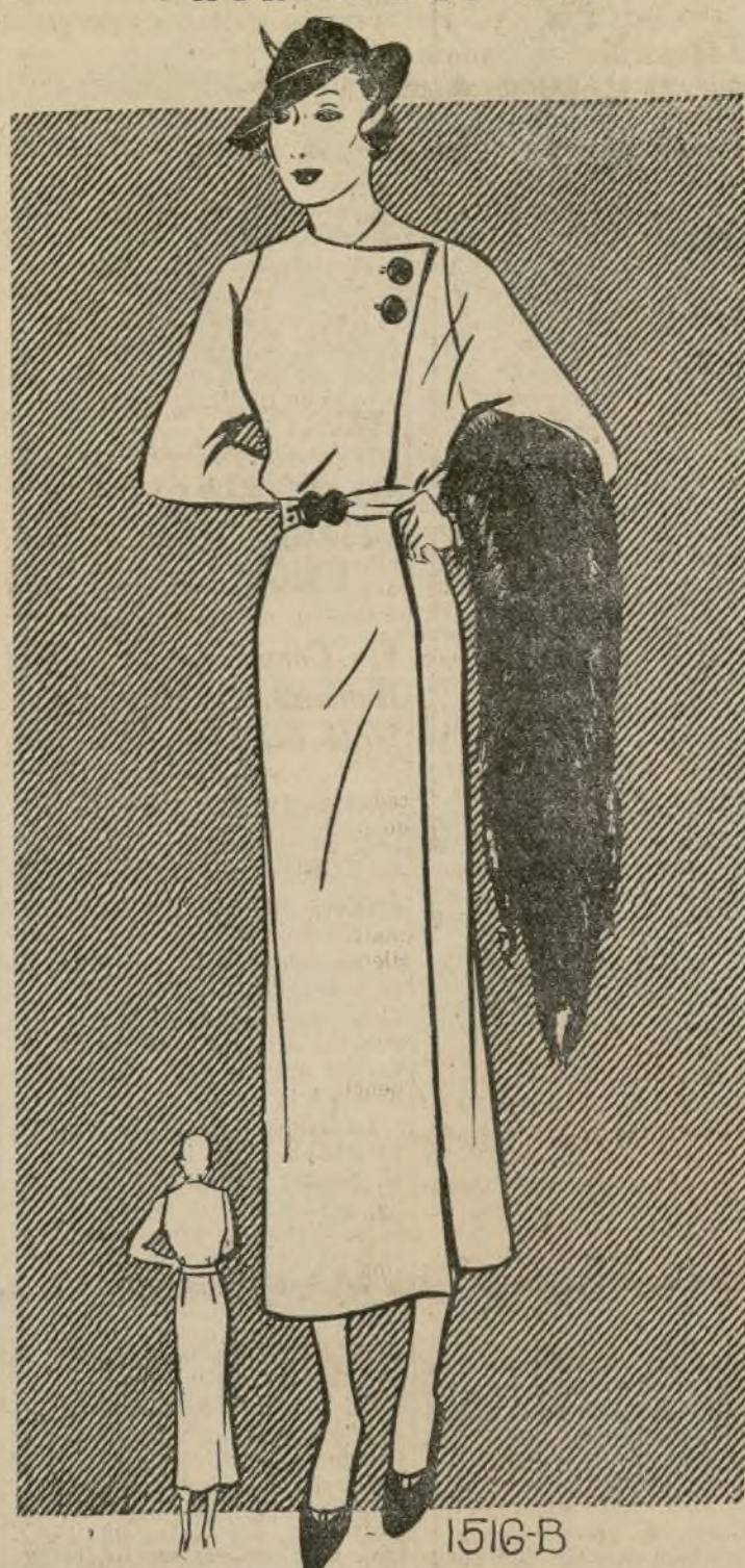
VESTIDO DE CALLE SENCILLO

1516-B.—El traje del croquis de hoy se verá muy atractivo ejecutado en lana de tejido flexible. Debido a la riqueza de las telas nuevas, es preferible que el modelo sea de una sencillez severa. Una de las lanas que se usará mucho a fines de este invierno y principios de la Primavera, es la lana de cuadros grandes escoceses. La combinación de azul marino y "beige" promete ser muy popular. Los materiales rayados también se llevan mucho. En los modelos de última novedad se ven estos géneros cortados al bies para las mangas y para el resto del vestido al hilo. La construcción de estos es sumamente sencilla, ya que se componen de tan pocas costuras, eliminando todo detalle de complicación. El traje de la ilustración, por ejemplo, es de líneas rectas, desde los hombros hasta la base.