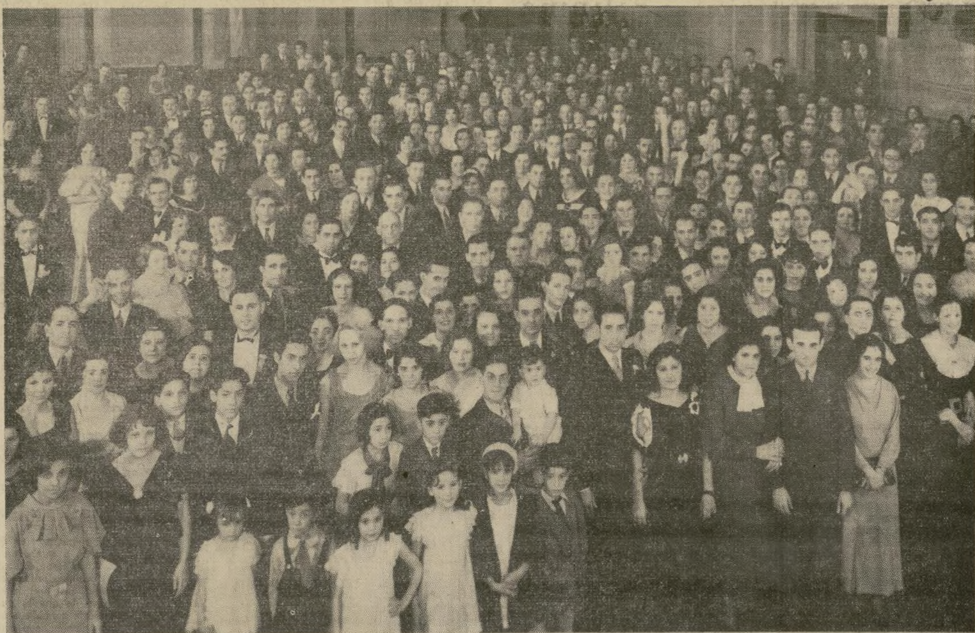
Parte de la selecta y numerosa concurrencia que acudió el domingo al festival organizado por esta agrupación de comerciantes hispanos de Brooklyn, conocida por Selected Merchants Assn., para conmemorar su primer aniversario, en el Odd Fellows Memorial Bldg. Los invitados disfrutaron unas horas sumamente