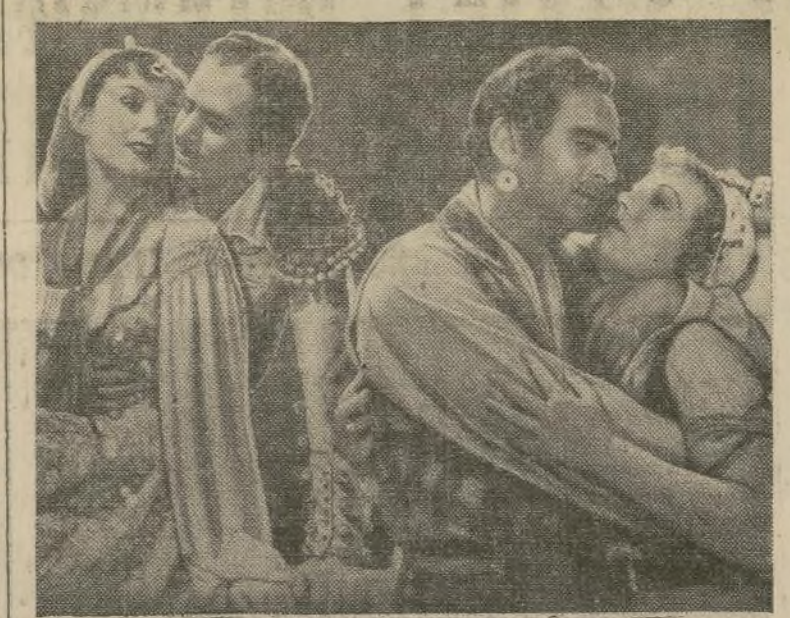
Fairbanks, donjuanesco y triunfal en su papel de burlador de mujeres.

El final de las películas en que interviene el genio cinematográfico sajón suele diferenciarse transcendentemente de las vistas de sentido "latino" — ahora si bien aplicado el título a la cinematografía hispana, y a la de Francia e Italia al mismo tiempo — levala a los palcos y encuentra los bien recordados ojos de Dolores, su esposa abandonada. Pero ella no le reconoce. El primer actor de la compañía avanza hacia las candelas. "Hay aquí una dama — vocifera — que puede decirnos si este hombre es o no es Don Juan."