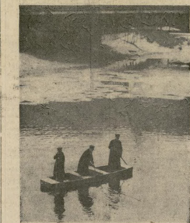
La policía sigue buscando cadáveres en el Río Grand, en Lansing, Mich., al que se arrojaron presas de pánico muchos de los pasajeros del Hotel Kerns, totalmente destruido por el fuego en la capital de Michigan.