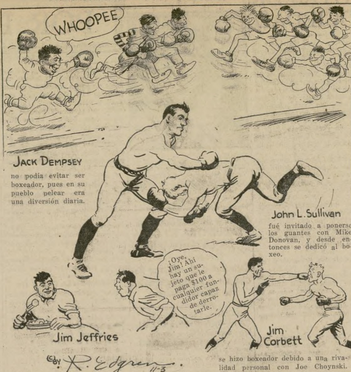
Jack Dempsey no podía evitar ser boxeador, pues en su pueblo peleó era una diversión diaria.

John L. Sullivan fue invitado a ponerse los guantes con Mike Donovan, y desde entonces se dedicó al boxeo.